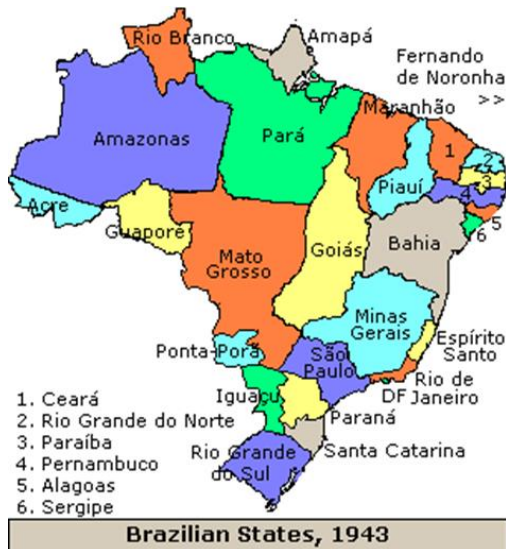
Mapas do Brasil, 1943.