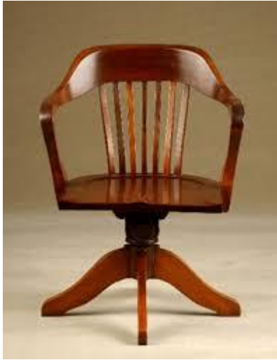
Cadeira Cimo, década de 1930. Museu da Casa Brasileira