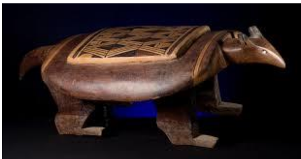
Banco de madeira zoomórfico dos

Responda as questões relacionadas com as imagens abaixo: