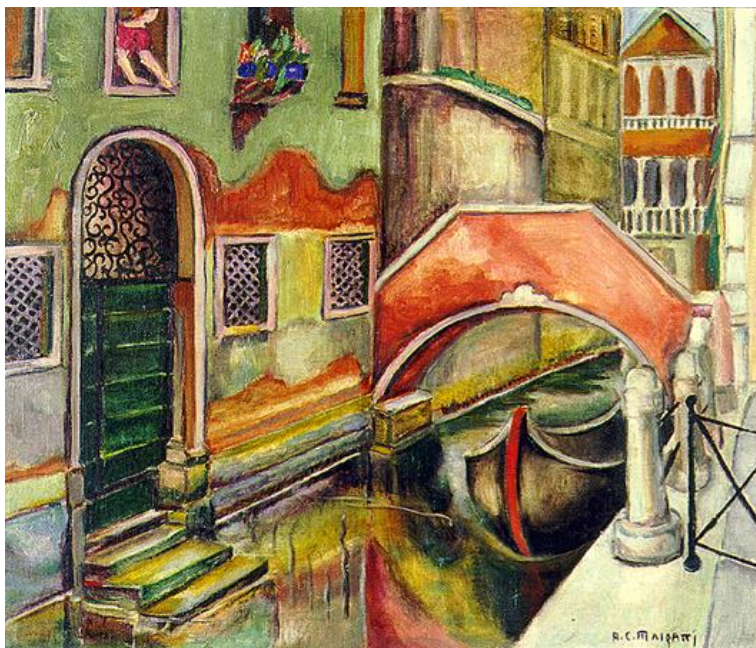
Canaletto, 1924. Anita Malfatti.

Anita Malfatti é uma artista brasileira que tornou-se famosa no início de sua carreira por usar com muita liberdade as cores em sua pintura. Observe uma de suas pinturas a seguir: