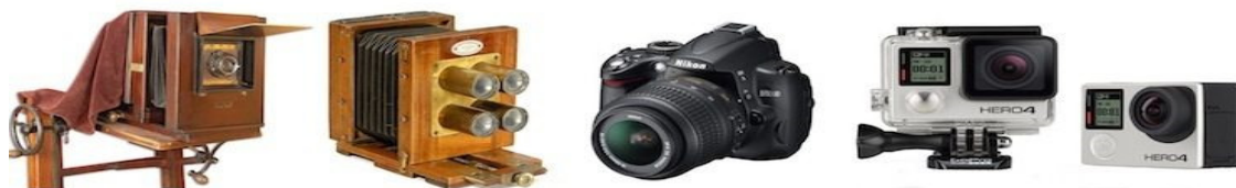
Máquinas fotográficas que fizeram parte da história da fotografia

Ao longo dos anos, com a evolução do modo de fotografar, a fotografia de casamento mudou bastante. A própria evolução da tecnologia provocou o desejo de produzir algo diferente e possibilitou evolução na forma de se capturar os momentos. No século XX, com a digitalização, houve um avanço fotográfico enorme. Hoje, por exemplo, não se lê uma matéria sem fotografia seja por um artigo em um site.