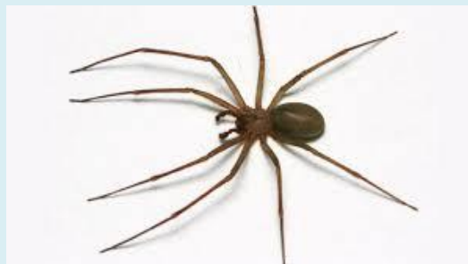
Aranha (comprimento: 6 centímetros)

Aranhas e escorpiões têm oito pernas. Eles não têm antenas nem asas. O corpo desses animais também é protegido pelo esqueleto externo.