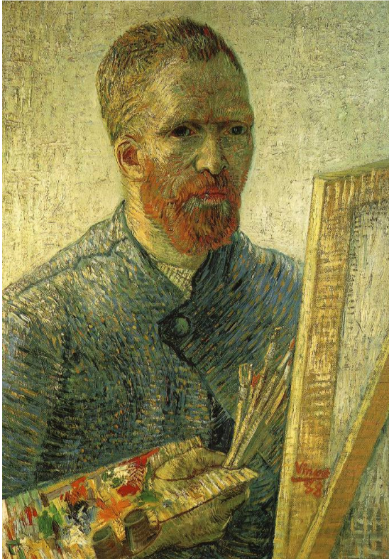
Van Gogh, 1888