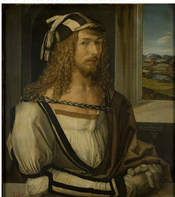
Selbstporträt, by Albrecht Dürer, 1498

- Observe os exemplos de autorretratos feitos em diferentes épocas e utilizando diferentes técnicas artísticas: