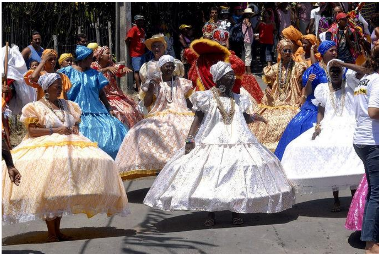
Festas como o maracatu são de influência africana

Além disso, várias palavras africanas foram incorporadas ao português brasileiro, como quilombo , marimbondo , moleque , farofa , cochichar , quitute , etc.