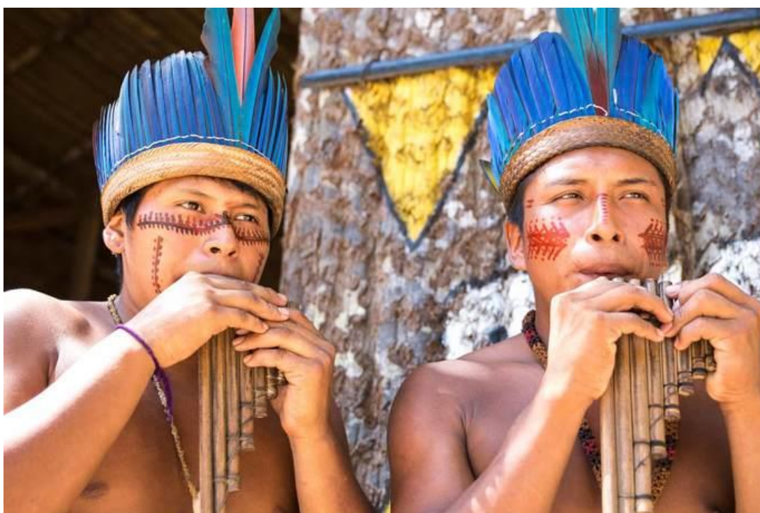
A cultura indígena sobrevive no Brasil através da arte

Na culinária, destaca-se o uso intensivo da mandioca, planta que havia sido domesticada pelos indígenas e que é item obrigatório em vários pratos brasileiros.