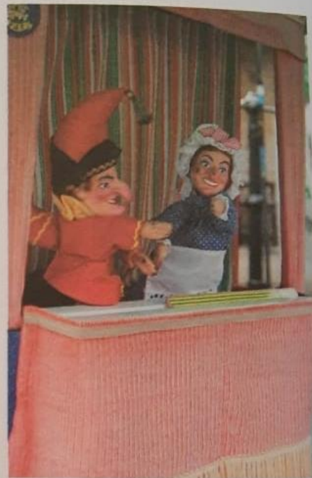
Apresentação de teatro de bonecos com os personagens Punch e Judy, na cidade de Burnley, Inglaterra, em 2016.

Na cultura popular inglesa, um casal de personagens mantém viva a tradição dos bonecos: o Senhor Punch e sua esposa Judy. Com toque de palhaço de circo, o Sr. Punch faz muitas brincadeiras e músicas para as crianças e os adultos.