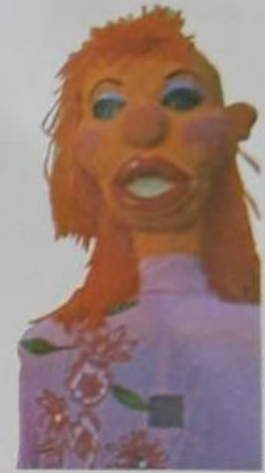
▼ Mamulengo no Carnaval do Pelourinho, em Salvador, Bahia, em 2006.