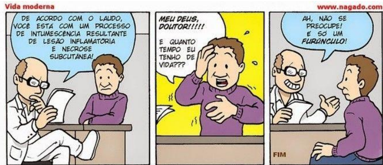
Baseado em uma coluna de Max Gehringer (Revista Época - 10/ 07/ 2006)

GÍRIA: Bons exemplos são as gírias , expressões populares de um determinado grupo social e os As gírias são expressões populares utilizadas por determinado grupo social.