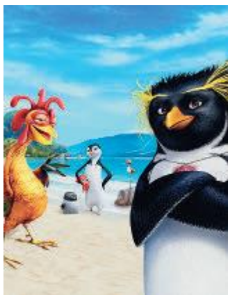
Tá dando onda. Direção: Chris Buck e Ash Brannon. Columbia Pictures, Sony Pictures Animation. EUA, 2007. DVD (85 min).