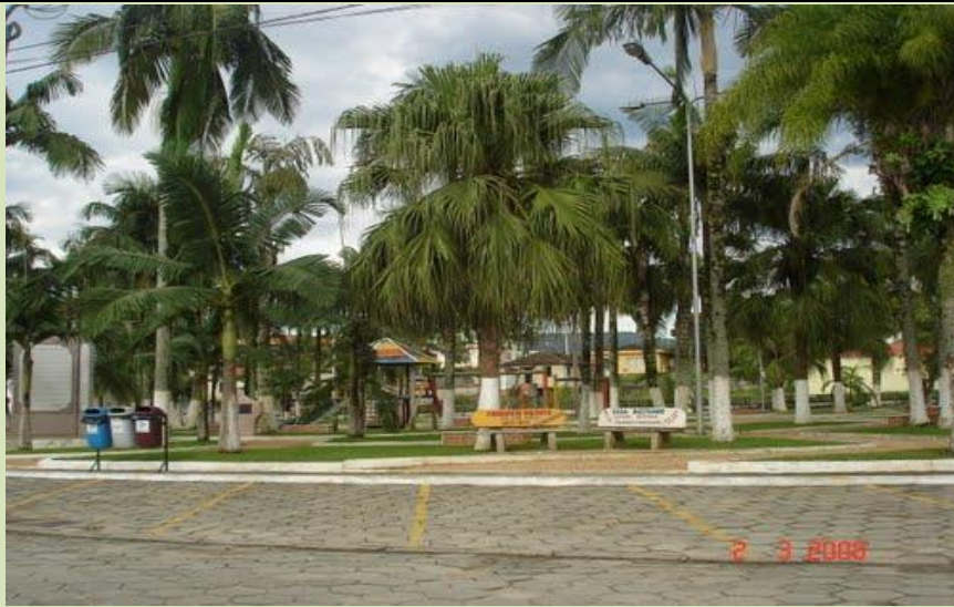
Fotografia da Praça Anésio Faust, centro de Grão-Pará.

SECRETARIA MUNICIPAL DE EDUCAÇÃO E CULTURA