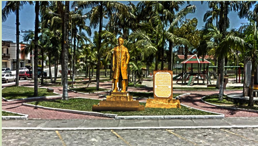
Monumento em homenagem a Dom Pedro de Orleans e Bragança – Príncipe de Grão-Pará (família que colonizou a região).

As praças também guardam a memória de um lugar.