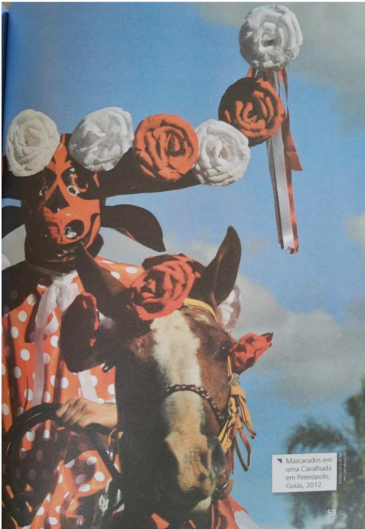
▼ Mascarados em uma Cavalhada em Pirenópolis, Goiás, 2012.

SECRETARIA MUNICIPAL DE EDUCAÇÃO E CULTURA