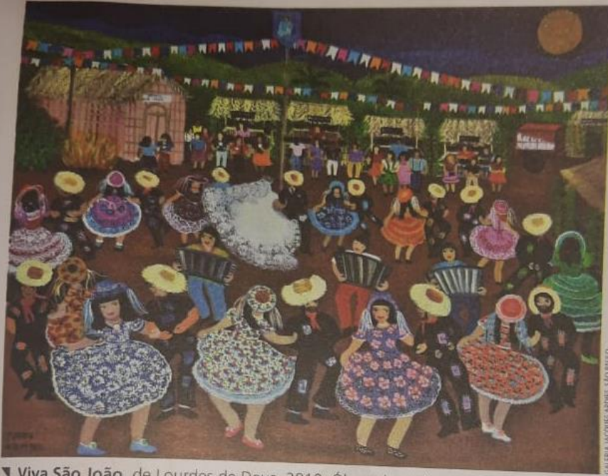
▼ Viva São João , de Lourdes de Deus, 2010. Óleo sobre tela, 50 cm x 60 cm. Pintura naif mostrando danças de festas juninas.

Veja as imagens a seguir. São exemplos de pinturas da arte naif que mostram danças e festas brasileiras.