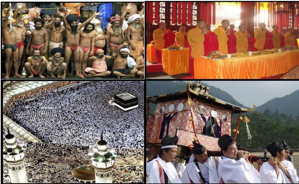
Diversidade Cultural e Religiosa

O continente abriga grande diversidade religiosa, com predominâncias por região ou país: animismo (Sibéria), hinduísmo e jainismo (Índia), siquismo (Paquistão e Índia), taoísmo e confucionismo (China), xintoísmo (Japão), budismo (Ásia Centro-Oriental e Sudeste Asiático), judaísmo (Israel), cristianismo (Rússia, Oriente Médio e Filipinas) e islamismo (Oriente Médio, Ásia Centro-Occidental e Indonésia). Há também grande riqueza étnica e linguística, com idiomas de todos os troncos, exceto o ameríndio e o africano. O mandarim, o bengali, o hindi, o russo e o japonês, presentes no continente, integram o grupo das dez línguas mais faladas no mundo.