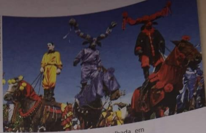
▼ Mascarados em encenação da Cavalhada, em Pirenópolis, Goiás, 2009. Os mascarados típicos de Pirenópolis usam a máscara de boi.

Onde você mora há apresentações de danças que contam histórias, como Caboclinhos, Cavalhadas, Maracatu, danças de quadrilhas e outras?