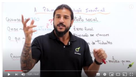
1ª Revolução Industrial - Geobrasil

A Revolução Industrial do século XVIII, que concentrou a mão de obra das atividades fabris nas cidades, foi o grande fator do desenvolvimento urbano. O capitalismo não criou as cidades, surgidas ainda na Antiguidade, mas as tornou o centro das atividades econômicas e culturais. Em função do capitalismo, as cidades passaram a ter inúmeras funções: portuárias, comerciais, industriais, militares e político-administrativas. Em resumo, o capitalismo industrial precisou, pela necessidade de produzir com custos mínimos e concentrar os operários em áreas reduzidas do espaço terrestre, criar as condições para que as cidades se tornassem metrópoles e megalópoles. O capitalismo contemporâneo ampliou o fenômeno urbano. Se antes, havia cidades, atualmente há megalópoles, onde a conturbação criou uma sofisticada rede de fluxo de capitais, informações, mercadorias e serviços.