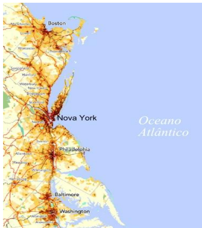
Mapa da Megalópole BosWash, no leste dos Estados Unidos *

SECRETARIA MUNICIPAL DE EDUCAÇÃO E CULTURA