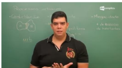
3 Conurbação, Metrópole, Megalópole e Megacidade

Já megacidade , diferentemente de megalópole, não é um termo econômico nem urbano, mas demográfico. Esse conceito foi criado pela ONU para designar todas as cidades do mundo que possuem uma população superior a 10 milhões de habitantes. Desse modo, uma megalópole muito provavelmente apresenta uma ou mais megacidades, mas nem toda megacidade forma em torno de si uma megalópole. O mundo conta, atualmente, com 21 megacidades, número que pode aumentar para 23 nas próximas décadas. Elas são resultado da concentração econômica e estrutural de seus países no presente e no passado, além de, em alguns casos, refletirem a elevada densidade demográfica em seus territórios. As megacidades atualmente existentes no mundo são: Tóquio (Japão), Déli (Índia), São Paulo (Brasil), Mumbai (Índia), Cidade do México (México), Nova York (Estados Unidos), Xangai (China), Calcutá (Índia), Daca (Bangladesh), Los Angeles (Estados Unidos), Karachi (Paquistão), Buenos Aires (Argentina), Pequim (China), Rio de Janeiro (Brasil), Manila (Filipinas), Osaka (Japão), Cairo (Egito), Lagos (Nigéria), Moscou (Rússia), Istambul (Turquia), Paris (França).