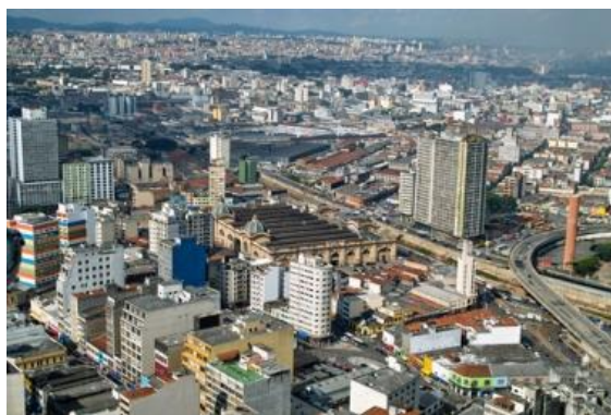
São Paulo forma a maior região metropolitana do Brasil